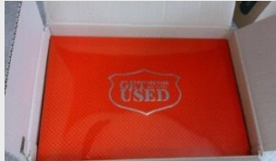
내박스 코팅 재질 사용