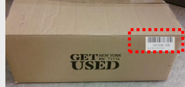
바코드 라벨은 외박스의 긴면 우측상단에 부착함.